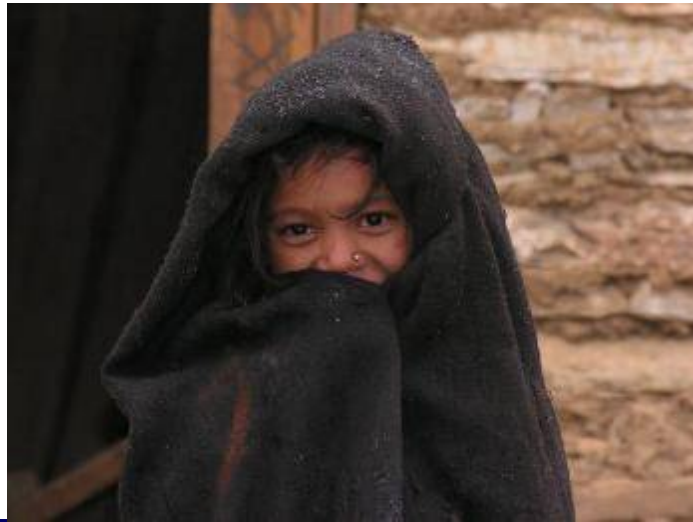
Westnepal - 2005